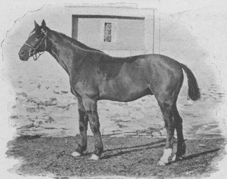
TYPE DE CHEVAL DE L'ÉQUIPAGE.