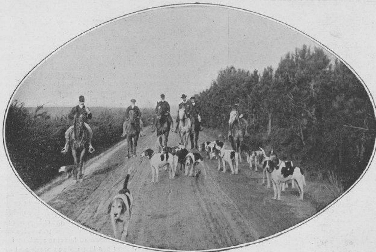
EN ROUTE POUR LA CHASSE.